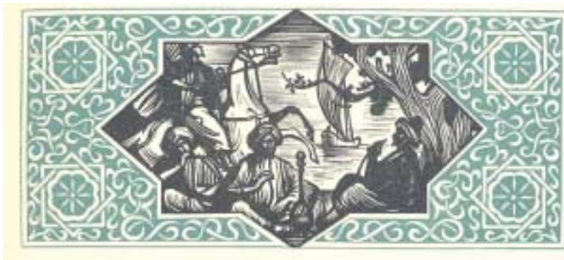
Nerval. - Voyage en Orient. - Ed. Richelieu, 1950 (BM de Senlis)

D'autres rencontres suivront dont les thèmes vous seront communiqués ultérieurement..