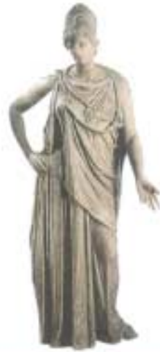
Athéna apportant la paix (vers 330 av.J.C.)