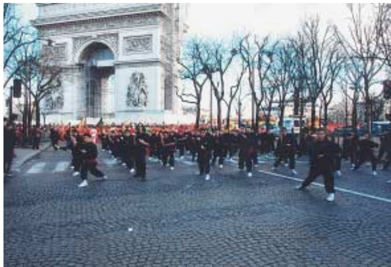
Les Senlisiens sur les Champs-Élysées pour le nouvel an chinois.