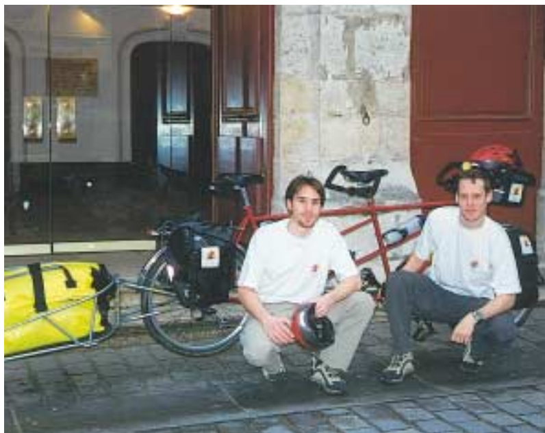
Quelques jours avant le départ la photo de famille devant l'Hôtel de ville.

Les deux aventuriers ont promis de nous donner de leurs nouvelles et de présenter reportages photos et vidéo de leur périple. Nous vous tiendrons au courant dans Senlis en Bref.