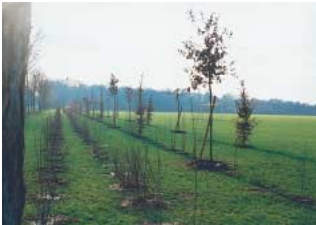
Plantations le long de la RN 17 devant les terrains de football.