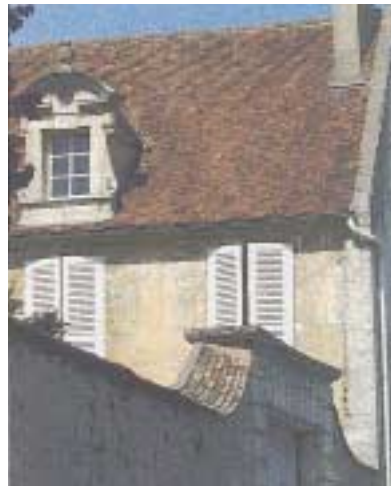
Badigeon ocre ancien.

Les maisons en moellons de tout venant, enduits en plein ou à pierres vues, représentent un type de construction économique qui implique la mise en œuvre d'un enduit destiné à la fois à pasticher la façade de pierre de taille, et à protéger le blocage de maçonnerie disparate, des intempéries. A Senlis, une ma-