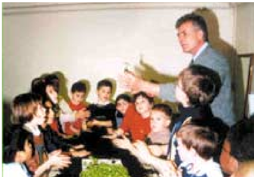
Cette année encore les enfants pourront bénéficier d'initiation au jardinage.

Ancienne église Saint-Pierre, Vendredi 2 avril, de 14h à 19h, Samedi 3 et dimanche 4 avril, de 9h à 19h. Entrée libre.