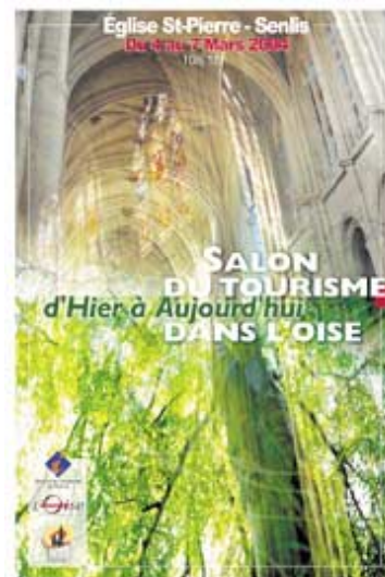
L'affiche du salon.

Nombre de places limitées : inscription au 03 44 53 06 40. Tarif par enfant : 5,20 €."