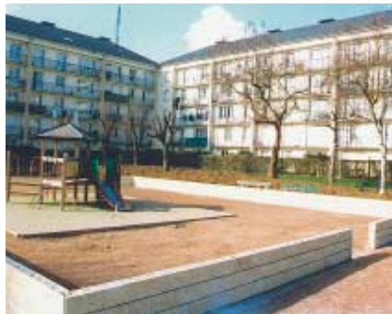
Clôture de l'espace de jeux place du Valois.