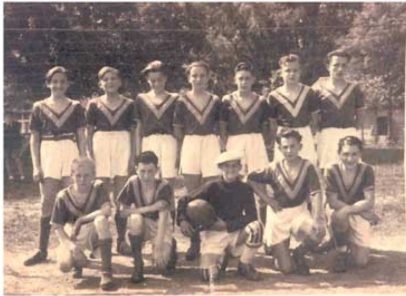
La photo présentée en novembre dernier.

Dans Senlis en Bref de novembre nous vous avons présenté une jeune équipe de footballeurs et fait appel à la mémoire des Senlisiens pour reconstituer la composition de cette équipe.