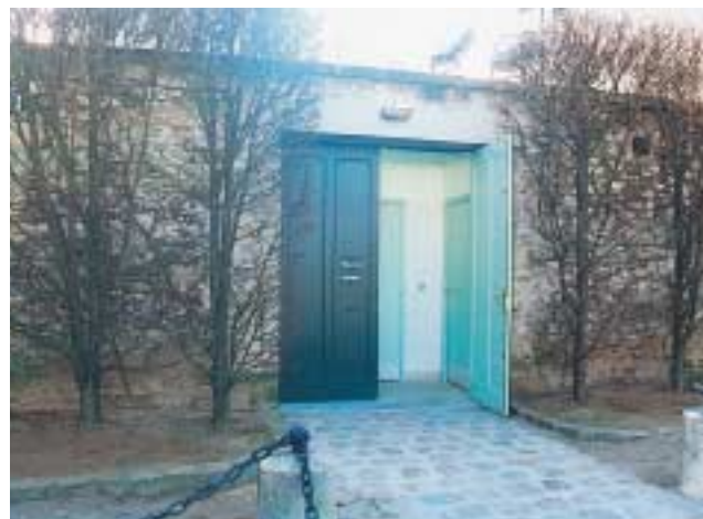
Aménagement de toilettes accessibles aux handicapés et d'une place de stationnement spécifique place du Parvis Notre-Dame.