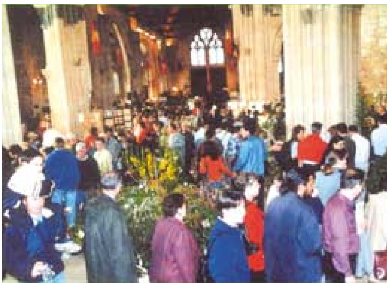
Affluence dans l'ancienne église Saint-Pierre lors du salon 2003.

Pendant trois jours l'ancienne église Saint-Pierre sera le rendez-vous obligatoire des passionnés de jardins et de la nature.